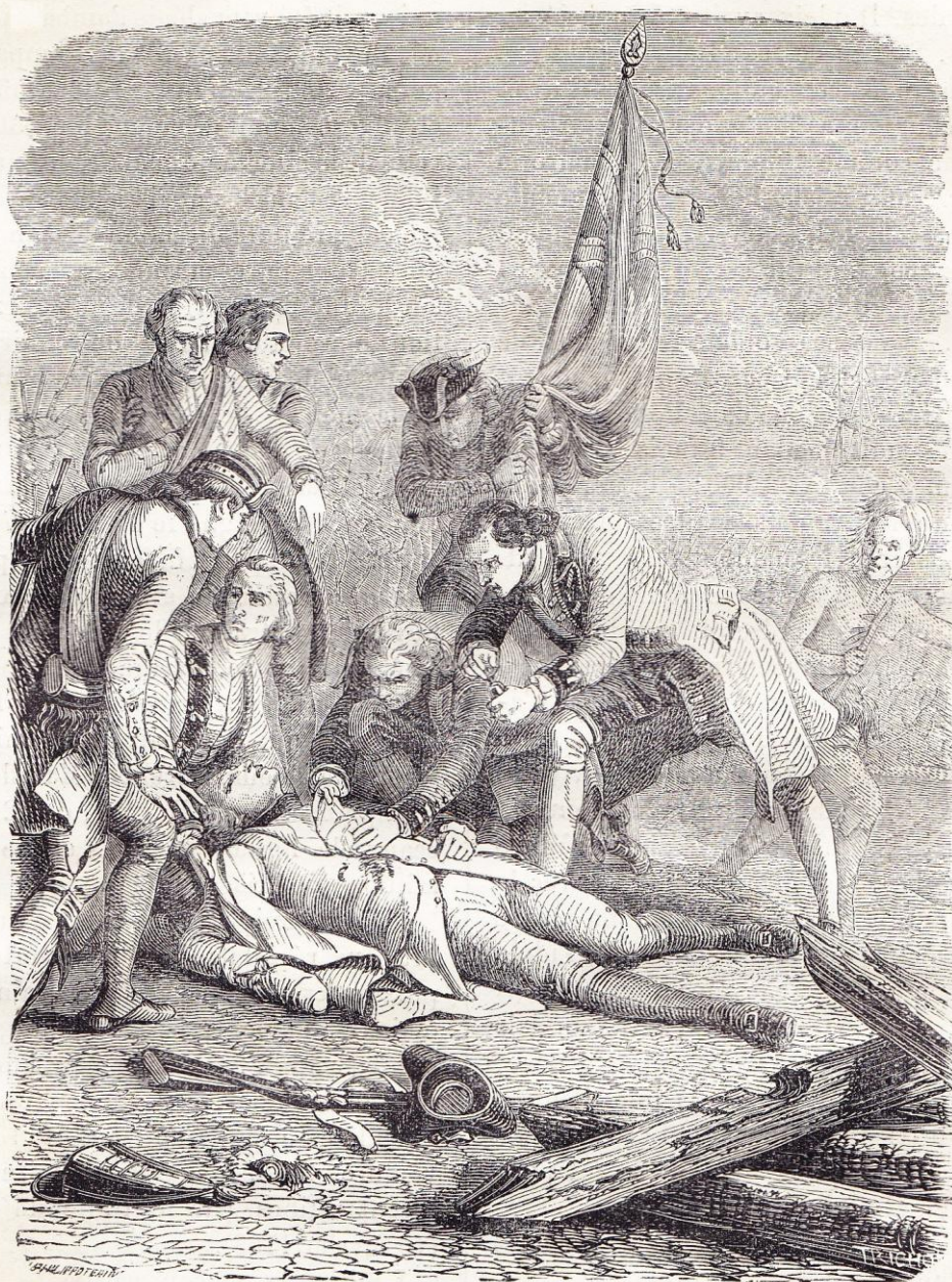
Mort du général Wolf (1759).

détruisirent 37 vaisseaux de ligne et 56 frégates ; alors ils s'enhardirent, firent sur nos côtes des tentatives qui restèrent infructueuses ; une d'elles même, à Saint-Malo, leur coûta 5 000 hommes tués ou pris par le duc d'Aiguillon et la noblesse bretonne ac-